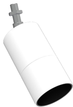
Tige filetée M10x1 + écrou